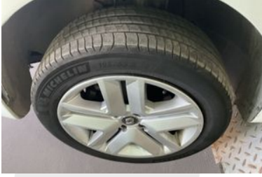
Sol Ön Lastik