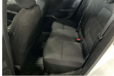
8. Araç için sağ arka sıra