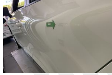
SOL ARKA KAPI