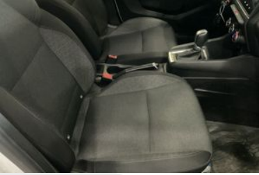
KOLTUK DÖŞEMELERİ VE AYAR DÜĞMELERİ