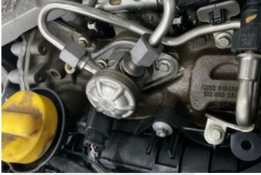
MOTOR YAĞ SIZDIRMAZLIĞI