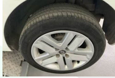
Sol Arka Lastik