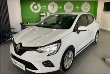
1. Sol Ön Çapraz