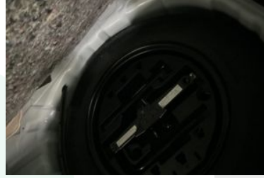
STEPNE VEYA TAMİR KİTİ