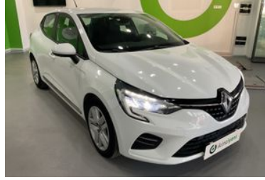
2. Sağ Ön Çapraz