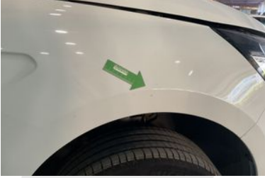
SAĞ ÖN ÇAMURLUK