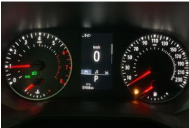
11. Araç için kadran