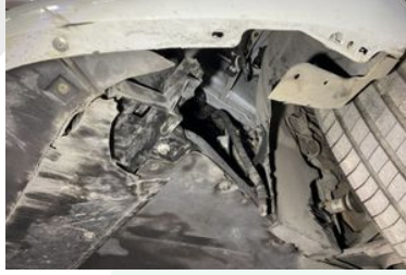
MOTOR ALT MUHAFAZA