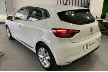
4. Sol Arka Çapraz