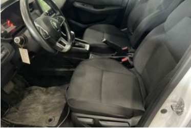
7. Araç için sağ ön sıra