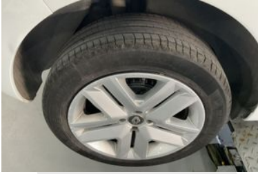
Sağ Arka Lastik