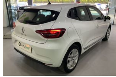
3. Sağ Arka Çapraz