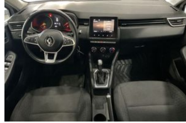
6. Araç için ön Konsol