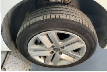
Sağ Ön Lastik