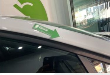
SAĞ ÜST DİREK