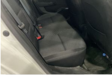
KOLTUK DÖŞEMELERİ VE AYAR DÜĞMELERİ