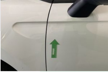
SOL ÖN KAPI